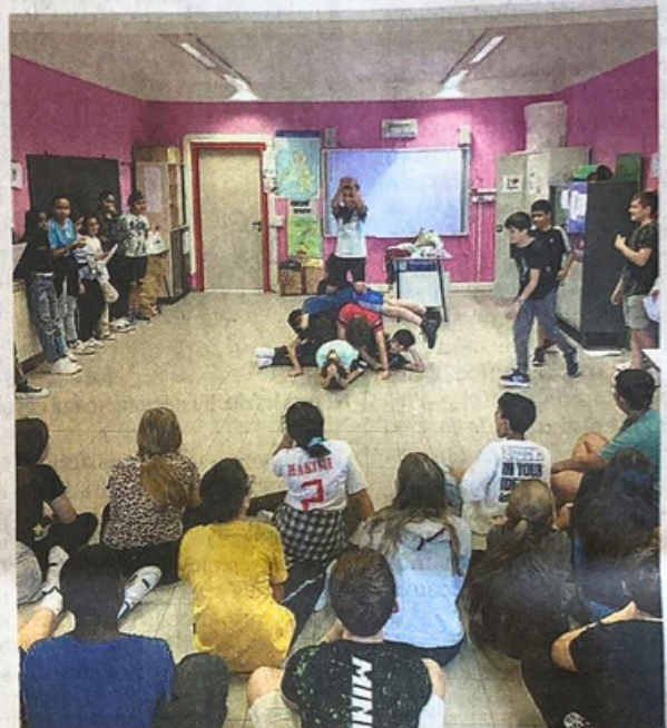
In classe. I ragazzi si sono esercitati e hanno tenuto uno spettacolo

zoli, che ha accolto con gioia questa iniziativa. Lo spettacolo non è stato solo un'esperienza teatrale, ma anche un'opportunità di apprendimento, ha promosso il senso di appartenenza e la consapevolezza civica tra gli studenti. La compagnia italo-francese (che è disponibile anche ad altri progetti coi giovani nel Belpaese) ha dimostrato come il teatro possa essere utilizzato per educare, ispirare e coinvolgere gli studenti fin dai primi giorni di scuola. La leggerezza con cui gli attori hanno trattato tematiche impegnative ha reso lo spettacolo coinvolgente e divertente. //