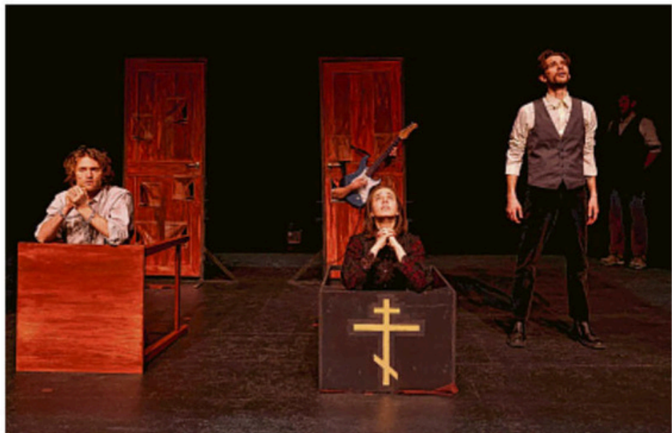
Les comédiens des Kro Zoriginals, d'Amata et de LAPO, proposent une sortie de résidence à Benoît XII.