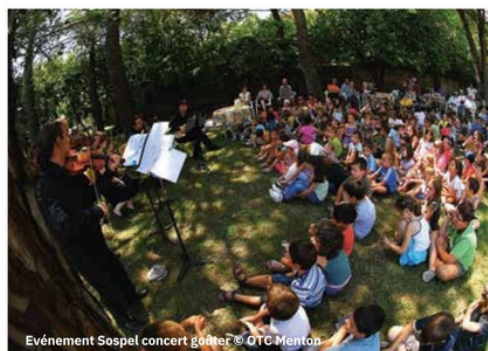
Événement Sospel concert gouter