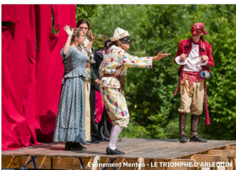
Événement Mentim - LE TRIOMPHE D'ARLEQUIN