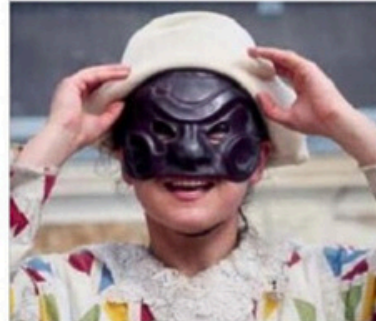
Spettacolo di circo in piazza dei Mercanti

nale, sabato grasso, in piazza dei Mercanti. Ma ci sono altri giorni caldi prima di arrivare alla data clou. Sabato 18 febbraio alle 11 il festival apre alla Fabbrica del Vapore con L'asino d'oro , una storia in cui il protagonista Lucio si trasforma in asino ed è prigioniero dei briganti. Alle 15,30 il divertimento si sposta in Largo San Dionigi Prato-centenario, zona Niguarda, dove arriva Il trionfo di Arlecchino , narrazione ambientata in una Venezia immaginaria in cui si vede un Pantalone intento a utilizzare il matrimonio della propria figlia per arricchirsi. Poi domenica 19 di nuovo teatro all'aperto, con due