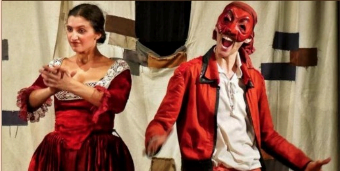
« Le triomphe d'Arlequin » par Amata Compagnie.

« Le triomphe d'Arlequin » de Carlos Bosso interprété par Amata Compagnie est tiré de divers canevas de commedia dell'arte, il représente un hymne à la liberté d'aimer dans un monde gouverné par l'égoïsme et les intérêts personnels. L'action se déroule dans une Venise imaginaire où habite un vieil épicier français, Pantalone, qui veut profiter du mariage de sa fille pour s'enrichir. Un capitaine vaniteux va tenter d'enlever la belle Fiordalisse, la fille de l'épicier Pantalone, avec l'aide de l'omniprésent Arlequin. Ce dernier va se révéler être la belle Gelsomina qui, comme Viola dans « La Nuit des Rois » de Shakespeare, s'est déguisée en serviteur par amour. La courtisane Isabella va tomber amoureuse du frère du Capitaine Spaventa, le renommé Capitaine Rodomonte, et pour le suivre elle s'enfuit déguisée en homme... Spectacle vendredi 12 mai à 19 h, à La Cure d'Air Trianon, 74/75 rue Pasteur. Entrée gratuite.