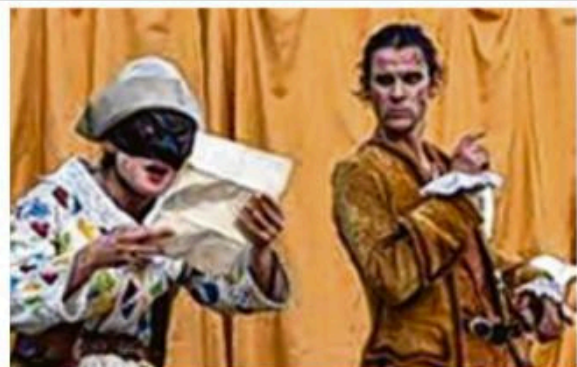
La compagnie AMATA est comme chez elle à la Cour du Barouf.

S.D. A 13h à la Cour du Barouf ; 12/17 €